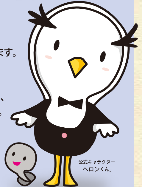
公式キャラクター 「ヘロンくん」